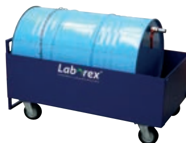
Déshuileur, uniquement sur solution lessivielle